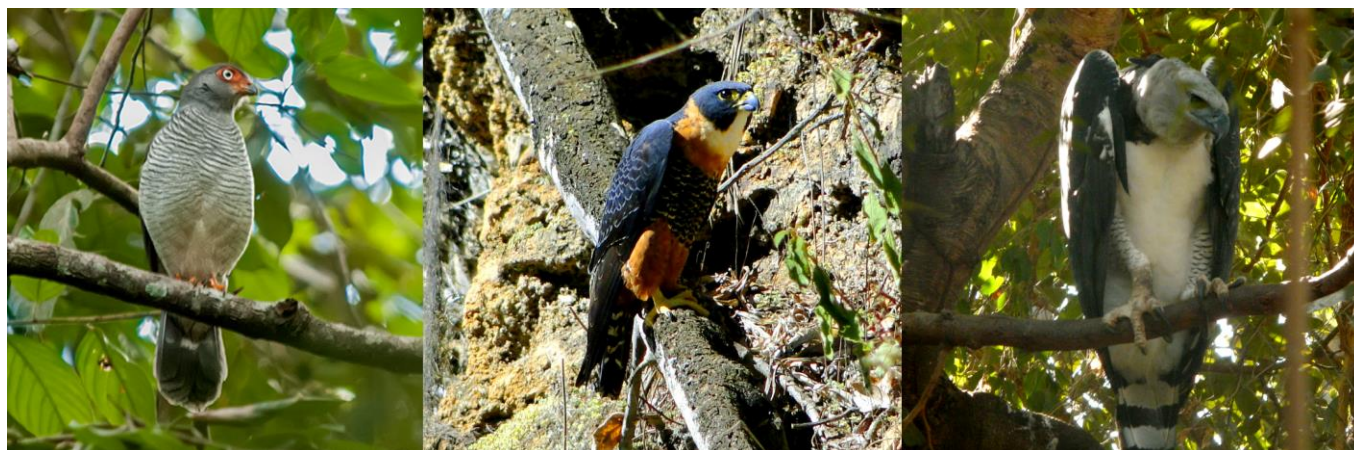
Figura 3. Alguns rapinantes raros da Mata Atlântica. À esquerda, falcão-críptico ( Micrastur mintoni ) registrado em Linhares/ES. Foto: Gustavo Magnago; ao centro, falcão-de-peito-vermelho ( Falco deiroleucus ) em Alfredo Chaves/ES. Foto: Joselito Nardy Ribeiro; à direita, harpia ( Harpia harpyja ) em cativeiro. Foto: Willian Menq.

Atlântica baiana. Séculos depois, em 1946, Herbert F. Berla do Museu Nacional do Rio de Janeiro afirmou ter registrado a espécie nas matas da Usina São José, em Pernambuco (Berla 1946). Posteriormente, diversas expedições ornitológicas foram realizadas na região nordeste e nenhuma evidência da presença de S. ornatus foi obtida. Talvez Berla (1946) tenha se enganado na identificação. Além de não oferecer nenhum detalhe da identificação, o autor também não registrou o S. tyrannus , que é igualmente possante, possui silhueta similar e o único Spizaetus registrado com relativa frequência nos fragmentos florestais do nordeste.