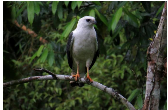
Figura 1. Gavião-pombo-pequeno ( Amadonastur lacernulatus ), espécie endêmica da Mata Atlântica.

Todos os táxons (residentes e migratórios) com distribuição dentro dos limites geográficos da Mata Atlântica foram considerados pertencentes à mesma (Figura 2.B). Espécies com registros apenas nas áreas limítrofes da Mata Atlântica, bem como espécies com ocorrência errante, não foram consideradas pertencentes ao domínio (Figura 2.A). Rapinantes com ocorrência exclusiva no domínio foram definidos como endêmicos (Figura 2.C).