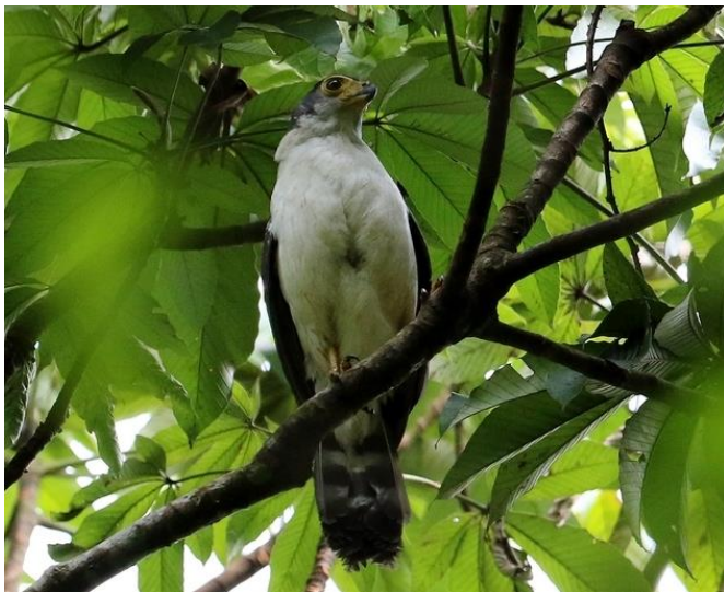
Tanatau ( Micrastur mirandollei ), em Alta Floresta/MT. Espécie raríssima na Mata Atlântica.

O M. mirandollei assim como o M. mintoni provavelmente estão seriamente ameaçados de extinção na Mata Atlântica. São escassas as informações biológicas dessas espécies, e seus status populacionais na Mata Atlântica são desconhecidos, contando com pouquíssimos registros pontuais.